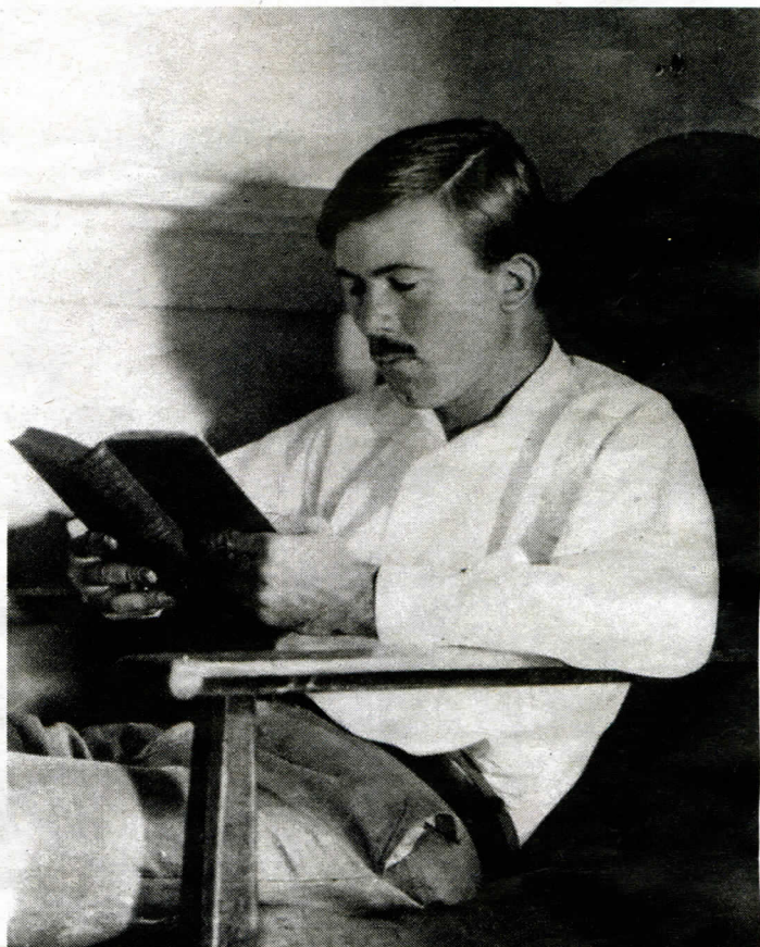
Gerald Brenan (1894-1987)

El volumen reúne textos escritos desde los años veinte hasta 1983, abarcando prácticamente toda su larga vida. Predominan los artículos y reseñas literarias, pero incluye también piezas autobiográficas, como la estupenda carta que describe sus vivencias en El Rocío, y dos notables ensayos sobre san Juan de La Cruz, que fueron