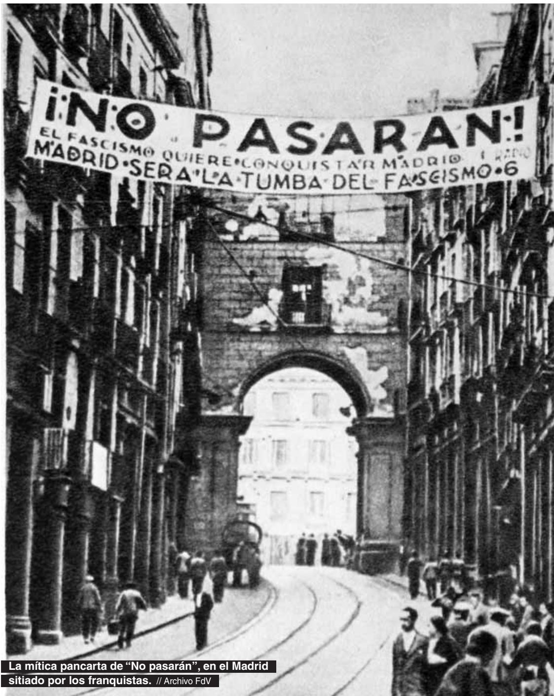
La mítica pancarta de "No pasarán", en el Madrid sitiado por los franquistas.

El libro de Fernando Castillo rescata del olvido o recupera para la memoria histórica nombres que protagonizaron algunos episodios poco conocidos pero que en su momento influyeron con más o menos trascendencia en la vida del Madrid sitiado por las tropas franquistas. Castillo ha investigado la amplia picaresca que se instaló durante aquellos